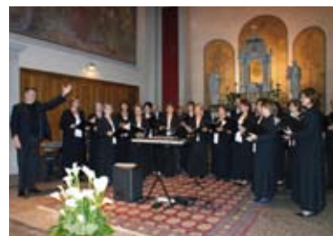
23 maggio - La Corale San Marco durante "Cascate di note"

La distribuzione del bollettino alle famiglie del quartiere è affidata a numerosi volontari che da anni offrono la propria generosa disponibilità. A tutti loro va il ringraziamento del parroco e del comitato di redazione per il prezioso servizio offerto alla comunità.