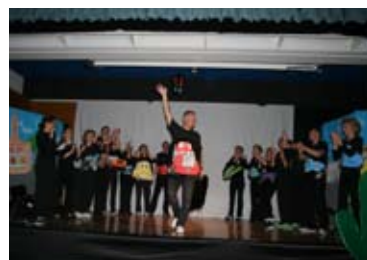
15-22 maggio - Festa della Scuola dell'Infanzia di San Marco