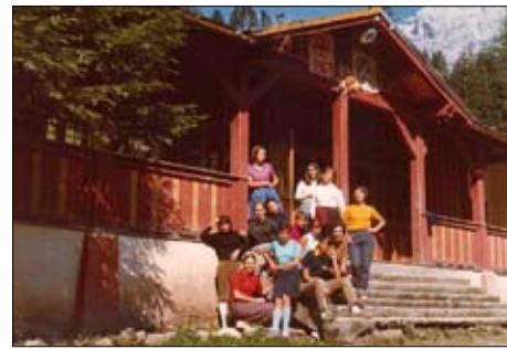
1969 - Il refettorio