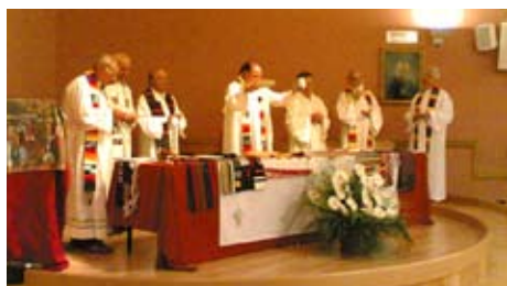
I sacerdoti concelebrano la messa alla conclusione della giornata

Lunedì 18 maggio presso il Centro di accoglienza "Ernesto Balducci" di Zugliano si è svolta una giornata di silenzio, di preghiera e digiuno conclusa con la celebrazione dell'eucarestia. L'iniziativa, proposta da una dozzina di sacerdoti impegnati