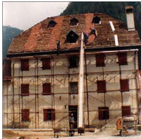
1980 - Lavori di ristrutturazione nella casa