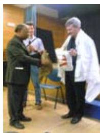
12 maggio - Incontro con Padre Push