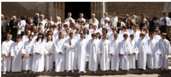
17 maggio - Prime Comunioni in Duomo