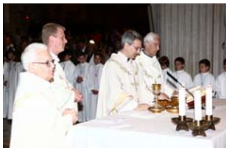
I sacerdoti durante la consecrazione