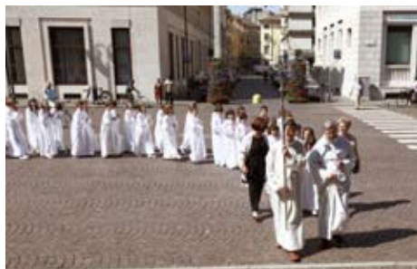
L'ingresso in Duomo