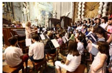
Il coro e l'orchestra di San Marco