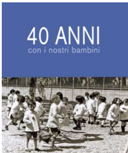
La copertina del libro

E' tradizione consolidata iniziare il periodo dell'Avvento, nella sua prima domenica, con la S. Messa animata dai bambini della Scuola Materna che propongono all'attenzione dei fedeli argomenti specifici del periodo. Quest'anno la celebrazione sarà caratterizzata anche per un avvenimento particolare: la presentazione del libro "40 Anni con i nostri bambini". Il testo inizia con alcune pagine della storia di questa "nostra" piccola-grande scuola con documenti inediti riguardanti i momenti più significativi della costruzione dell'edificio e degli avvenimenti che hanno reso per molti aspetti unica questa esperienza per tante persone. Diverse pagine sono state successivamente dedicate alle immagini dei nostri bambini, colte dall'inizio dell'attività educativa, che ci parla-