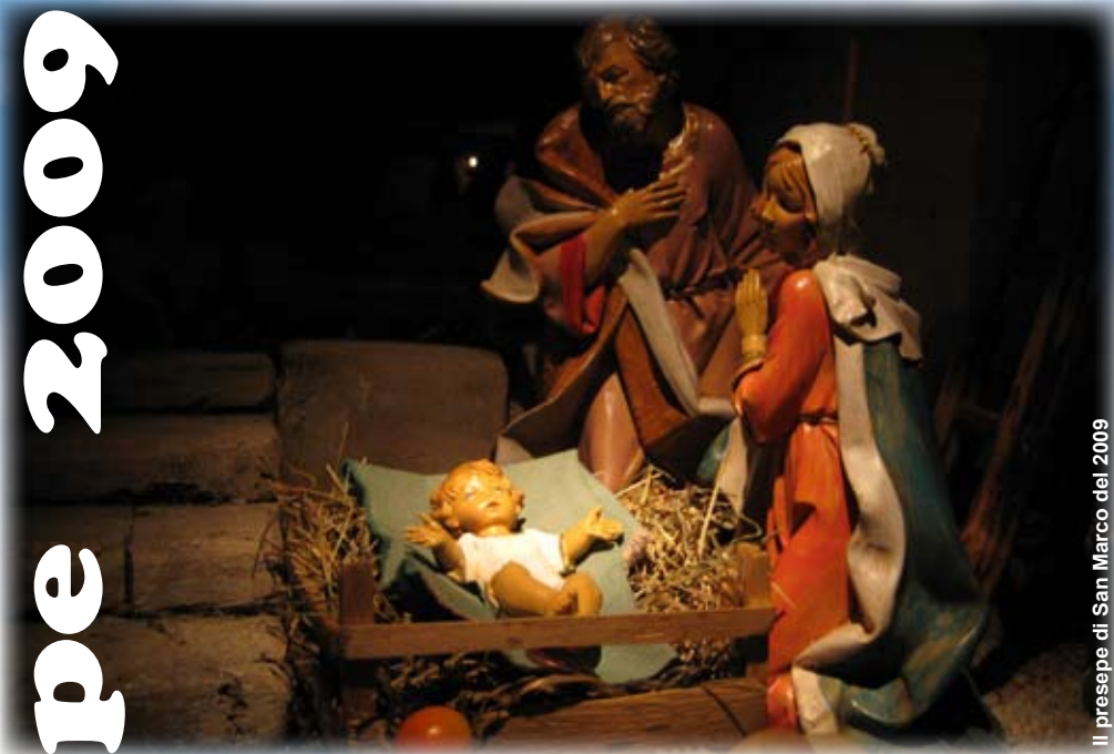
Il presepe di San Marco del 2009