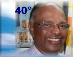
padre Push Panadam