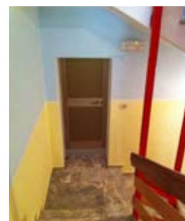
Nuovi colori sulle scale di Pierabech