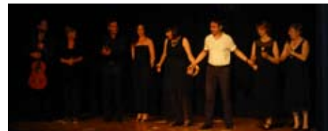
Le poesie di Garcia Lorca in Sala Comelli