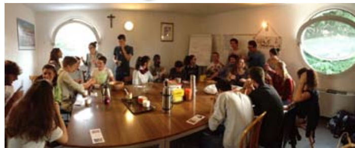
Le prime "Lodi" dei giovani in Oblo