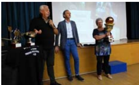
Premiazioni in Sala Comelli

Sabato 12 settembre si è svolto il 2° Trofeo Paolo Astante Festa di sport nel ricordo di due cari amici Basket di nuovo protagonista nel Parco Brun e nell'oratorio San Marco