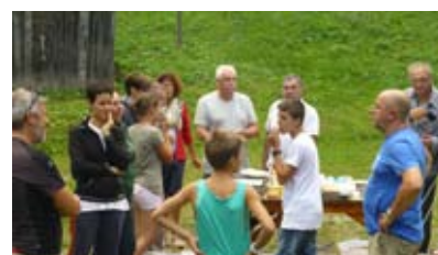
Grigliata al Campo Famiglie